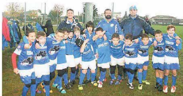
Una formazione Under 12 del Rugby San Vito

Debutto stagionale in casa per il Rugby San Vito al Tagliamento. Domenica (dalle 10) il club delle "Pantere" organizza il primo concentramento Fir dell'anno ospitando oltre 5 società regionali: OverBugLine Codroipo, Tricesimo, Black Ducks Gemonna, Rugby Sile e Pasion di Prato. In campo tutte le categorie del minirugby dall'Under 6 all'Under 12 per un totale di oltre 300 piccoli atleti. Per l'occasione sarà utilizzato l'impianto della Tilaventina Calcio a Ligugnana di San Vito (via Trieste) sul quale saranno ricavati 4 rettangoli di gioco. La squadra di casa, coadiuvata dal Rugby Sile con il quale è in piedi già da tempo un rapporto di collaborazione tecnica, schiererà una formazione in tutte le categorie. «Quest'anno abbiamo già partecipato a due concentramenti Fir, a Polcenigo e a Codroipo - spiega il responsabile del settore minirugby, Pier-