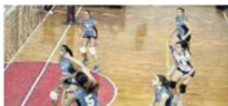
SANVITESI Le ragazze della Cap Arreghini completano una fase d'attacco

L'ASTRA CERCA IL TERZO SIGILLO CLIMA AMBIENTE BATTUTO NEL RECUPERO DI RIVIGNANO