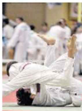
SUL TATAMI Sfide marziali