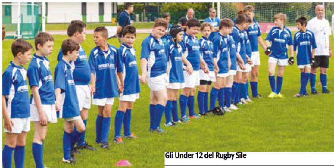
Gli Under 12 del Rugby Sile

Schiera l'Under 14 e le categorie del mini rugby