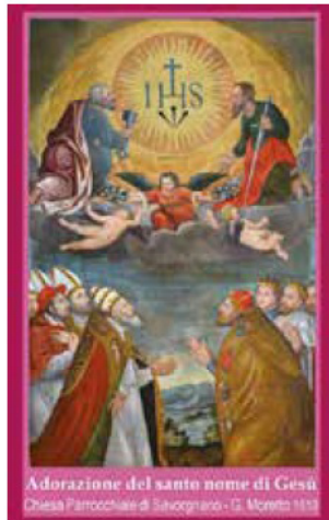
Adorazione del santo nome di Gesù Chiesa Parrocchiale di Savorgnano - G. Moretto 1853

Il 25 luglio del 2016, il giorno di San Giacomo, nel corso della celebrazione in onore del nostro Patrono, abbiamo ringraziato Dio per i 40 anni di presenza di don Luciano alla guida della nostra Comunità e per sottolineare il particolare clima di festa, le Associazioni e i Gruppi del paese (Associazione Culturale "Italo Michieli", Ana Gruppo di Savorgnano, Anea Associazione Nazionale Emigrati ed Ex-Emigrati in Australia e Americhe, Asd Gruppo Pescatori Sportivi "La ter-